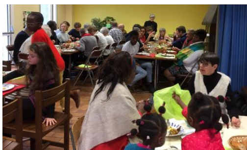
Repas avec petits et grands