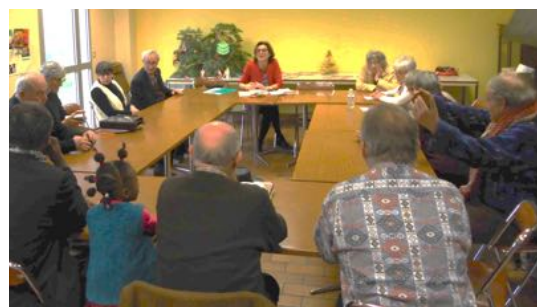
Puis animation biblique l'après-midi avec le groupe des adultes