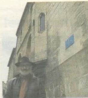
La chaire de Calvin, vue de l'extérieur : il y prononça des leçons évangéliques.

Du 2 au 29 mai, à la médiathèque, Sur les pas de Calvin à Bourges, inauguration le 12 mai à 18 h 30. Conférences : par Remy Hebbing, Jean Calvin, une pensée décapante, le 26 mai à 20 h 30 au temple de Bourges, 3, rue Vieille-Saint-Ambroix. ; par Jacques Blandinier, Calvin : souveraineté divine et droits humains..., le 12 juin à 20 h 30 au temple de Bourges. Contact : Accolade, tél. 02.48.24.76.50.