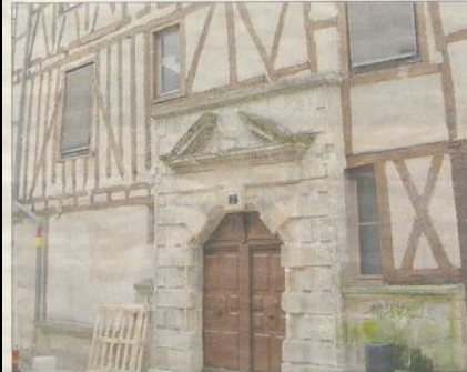
POSSIBILITÉ. Au coin de la rue Mirebeau et de la rue de la Poëlerie, la maison où Calvin a probablement logé.

La Grosse Tour. _ En 1539, accusé de luthéranisme, le moine bénédictin Jean Michel fut dégradé devant le portail de la cathédrale Saint-Étienne, étranglé puis brûlé en décembre devant la Grosse Tour. En mars 1544, pour le même motif, l'escolier Antoine de la Vau subit la même exécution.