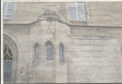
CHAIRE. Vue extérieure de la chaire de la salle Calvin qui à l'époque de Calvin était un réfectoire où les étudiants s'exerçaient à l'art oratoire.

auteur de cet « iconoclasme » (la décapitation des saints) en réaction à la présence d'images taillées « dans les Eglises. Calvin protesta justement contre ces dégradations. »