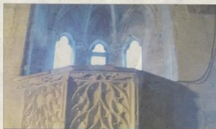
VESTIGE. La chaire de la salle Calvin, hélas aujourd'hui interdite au public.

Les galeries du cloître que l'on découvre en entrant par le portail ouvert sur la rue Mirebeau datent de la reconstruction au